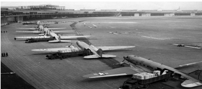
U.S. Navy Douglas R4D and U.S. Air Force C-47 aircraft unload at Tempelhof Airport during the Berlin Airlift, 1948-49

Estados Unidos, con ayuda británica, organiza un puente aéreo durante once meses y mediante más de 275.000 vuelos para abastecer a la población sitiada. Al mismo tiempo, la Casa Blanca hacía saber al Kremlin que no dudaría en usar la fuerza para hacer respetar los corredores aéreos que unían Berlín con la Alemania occidental. Los soviéticos midieron la voluntad occidental, mientras que los EEUU dieron prueba de firmeza ya que rehusaron abandonar Berlín, pero no hicieron ningún gesto directamente agresivo contra la URSS 8 .