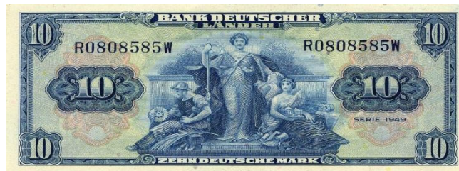
Deutsche Mark (1949)

En junio de 1948 los aliados occidentales crean una nueva moneda para sus zonas de ocupación: el Deutschemark 5 . Ante esto, las autoridades soviéticas adoptan medidas urgentes ya que con el objeto de cerrar el paso a los especuladores se instauró el control de mercancías y viajeros procedentes de Alemania Occidental.